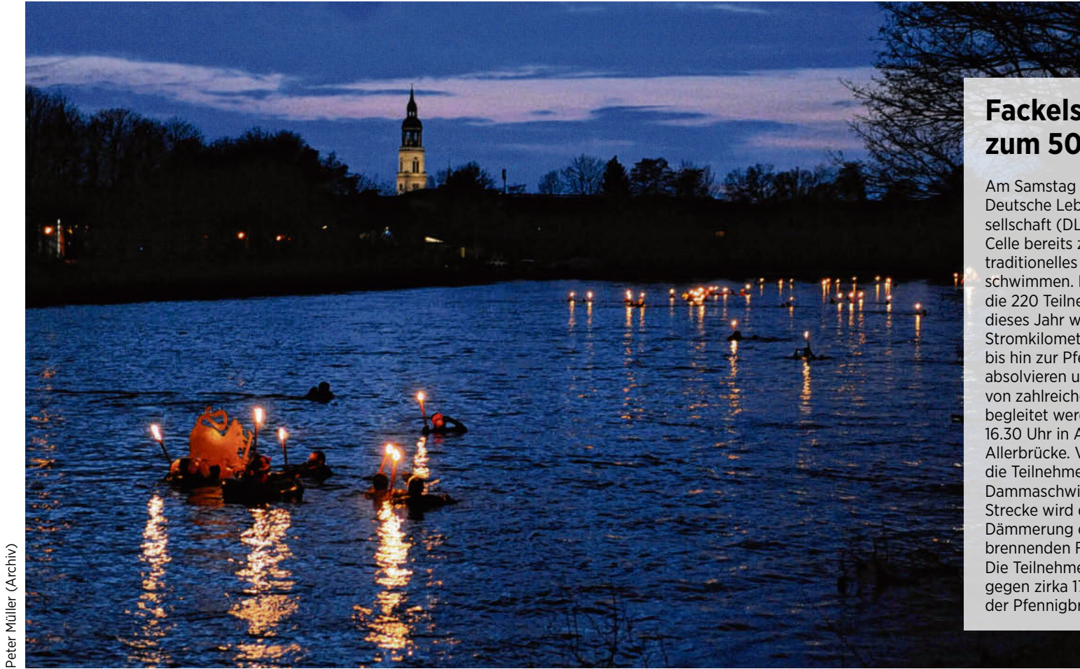
Peter Müller (Archiv)

„Karneval Total“-Party: Live mit Peppermint Petty & DJ Rico, ab 21 Uhr, Brauhaus Ernst August, Schmiedestraße 13, Hannover.